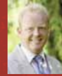
Detlev Prange Gemeinde Laer Bürgermeister